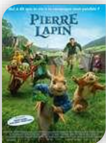
Judi 5 – Sauve