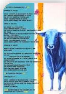
Vendredi 20 AU Lundi 23 – Cardet