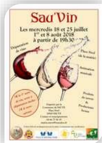
Mercredi 18 – Sauve