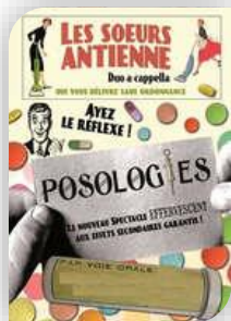
Judi 5 – Monoblet