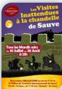
Mardi 31 Sauve

Contact : spectacle-cinema@piemont-cevenol.fr - Tarif : 5€