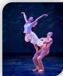
Samedi 7 - Sauve