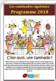
Jeudi 19 – St Hippolyte du Fort