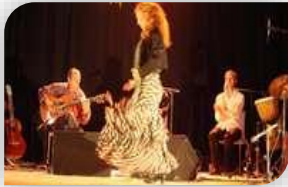
Jeudi 19 – Monoblet