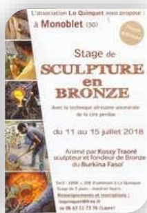
Mercredi 11 au Dimanche 15 – Monoblet