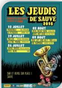
Jeudi 19 – Sauve