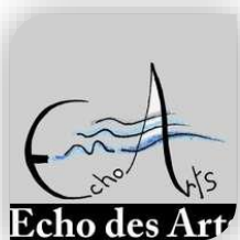
Samedi 28 au Samedi 4 - Monoblet