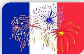
Vendredi 13 au Samedi 14 - Sauve