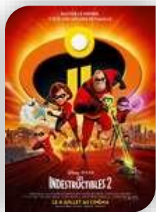
Jeudi 19 – Canaules et Argentières