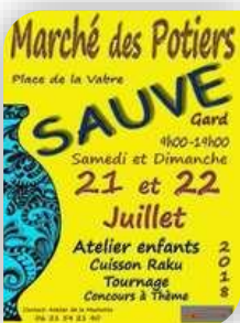
Samedi 21 et Dimanche 22 - Sauve

• Du VENDREDI 20 AU LUNDI 23 – CARDET – « Fête votive » La Mairie, La Boule Beau Rivage et le Club taurin de Cardet organisent leur fête traditionnelle. De nombreuses animations : Concours de boules, Abrivado, apéritif, encierro, Bal Au programme