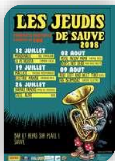
Jeudi 12 – Sauve