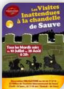
Mardi 10 - Sauve