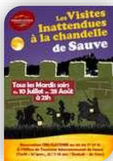
Mardi 17 – Sauve