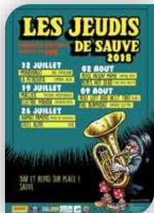
Jeudi 26 - Sauve