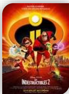
Mercredi 25 - Carnas

Un moment riche à partager, à passer en famille, ou les exposants créateurs se feront un plaisir de vous expliquer leur profession exercée avec passion.