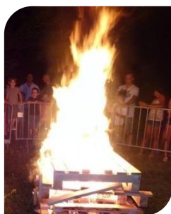
Vendredi 29 - Sauve