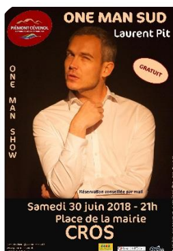
Samedi 30 – Cros