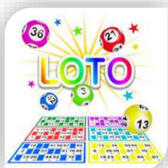
Quissac, St Hippolyte-du-Fort - Dimanche 4 Carnas – Dimanche 11