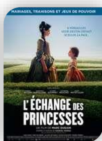
Samedi 3 - St Théodorit