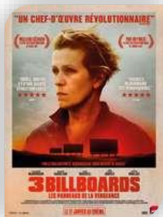
Orthoux – Vendredi 9