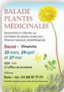
Dimanche 25 - Sauve