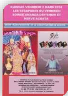
Vendredi 2 - Quissac